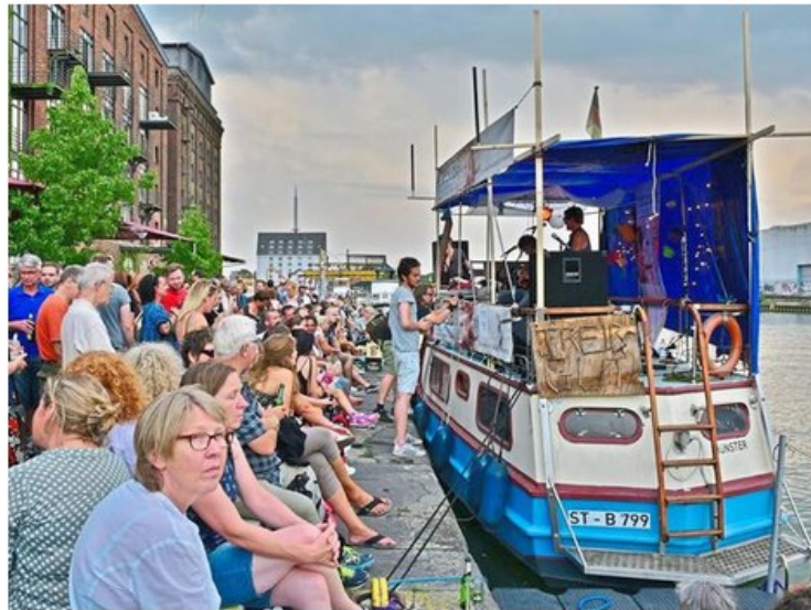
Trotz der hohen Temperaturen zog es viele Menschen als Zuhörer zum Treibgut Festival.

Am vergangenen Wochenende war der Hafen in der Hand der Singer/Songwriter-Musik. Das Treibgut-Festival hatte erstmals zwei Tage hintereinander an der Kaimauer angelegt, denn wegen der Fußballweltmeisterschaft war die Terminauswahl in diesem Sommer begrenzt.